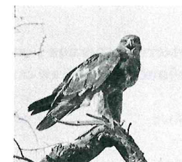
4. Степной орел

Напиши, как связаны между собой эти живые организмы.